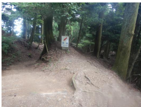
ツツジ尾根への分岐点