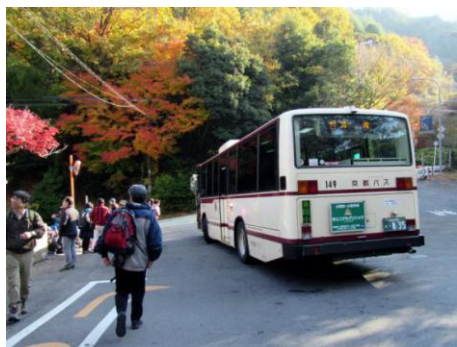
清滝バス停から出発

山頂には愛宕神社がありますが、三角点は離れたところにあり、時間がありましたら、訪れたいと思います。