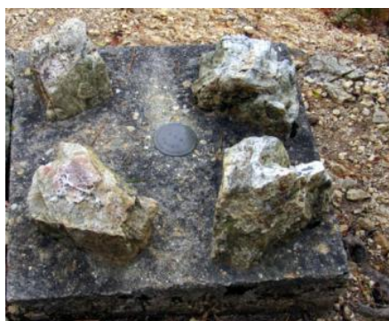
三角点は山頂にはない