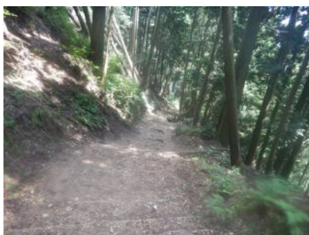
七合目の水尾別れから見た参道