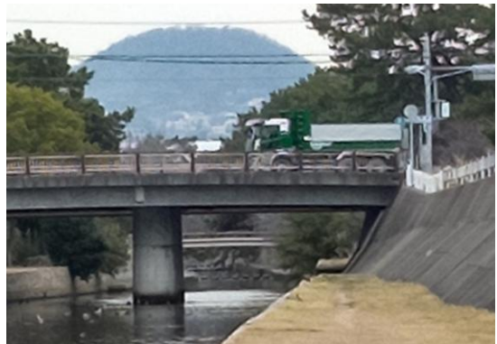
夙川最後の濱夙川橋と甲山