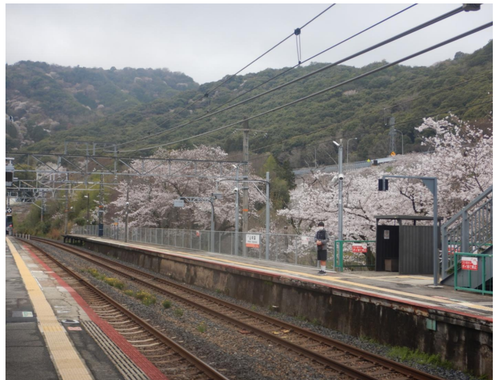
山中溪駅周辺は桜祭りを開催してました 駅前近くにある熊野古道の「夏目王子」や「山中宿跡」に行きたいと思います。

この山にはこれまで数回登ったことがあります。久しぶりに行った時には桜祭り開催の時期でした。