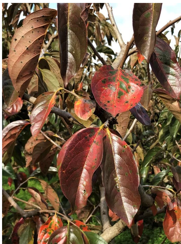
カキノキの葉も色づいている。