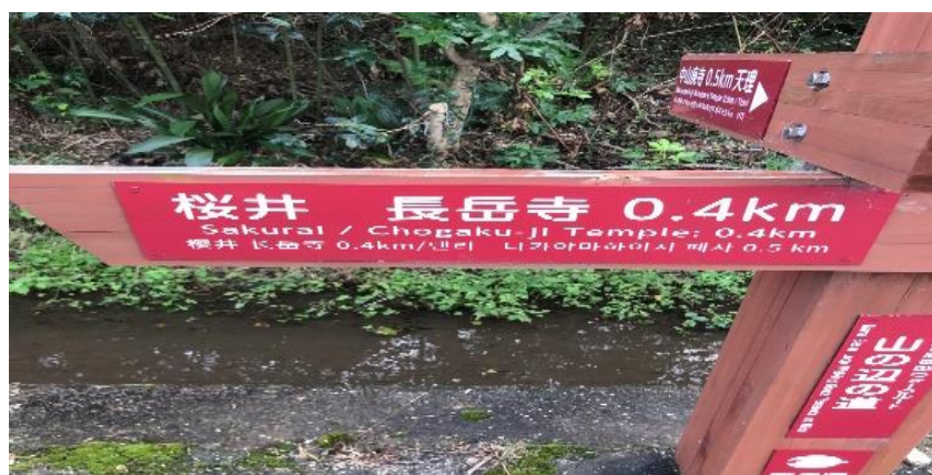
「皆さま、お疲れさまでした。」