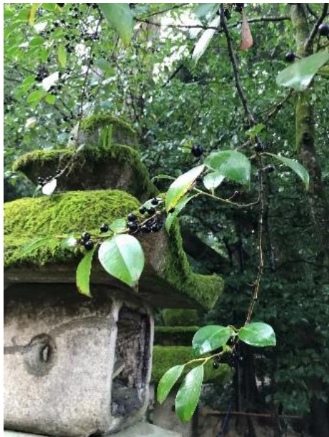
サカキの果実は黒く熟す。