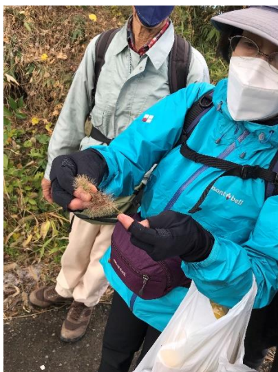
エノコログサのうさちゃん作り