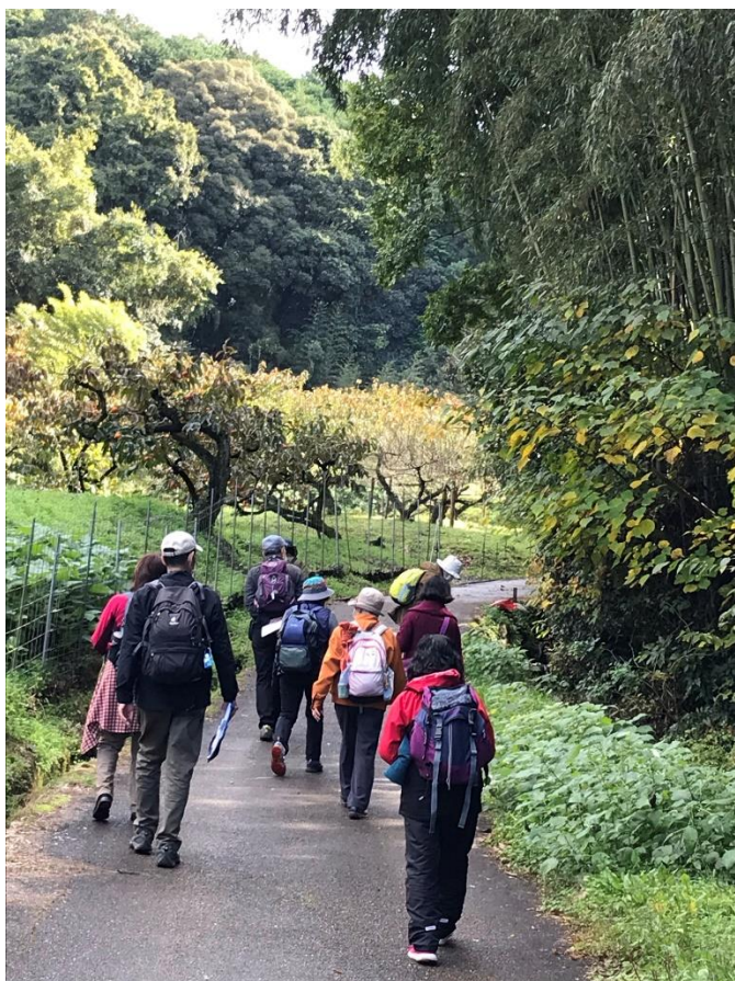
気持ちの良い秋の空気の中を歩く