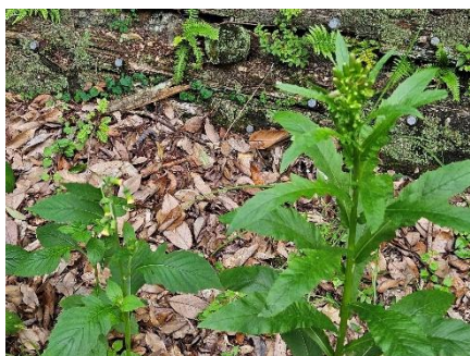
左ベニバナボロギク&右ダンドボロギク