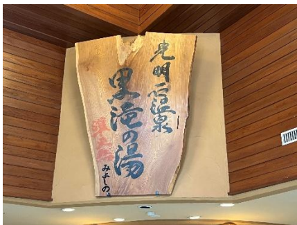
温泉 ♨ 黒滝の湯♪