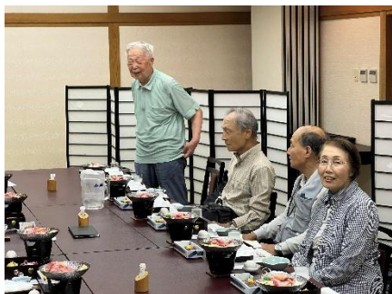
美味しい「水」で乾杯♪