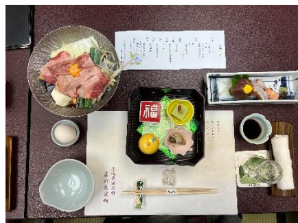
豪華昼食メニュー