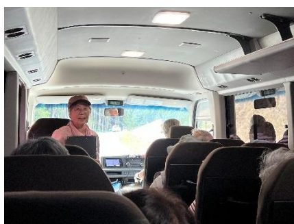
ネイチャーゲーム（平岡）♪