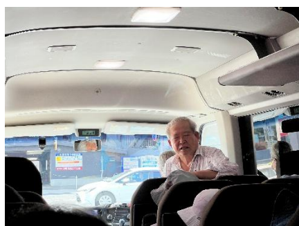
送迎バス内で行程説明（川口）