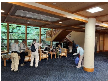
身支度を整え観察会準備