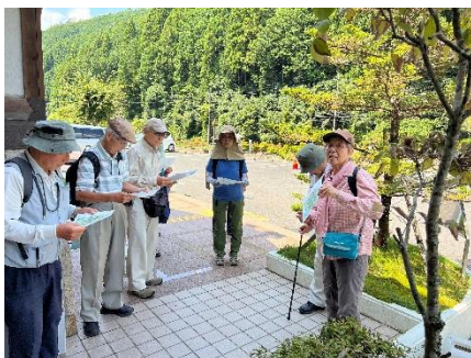
観察会出発前説明