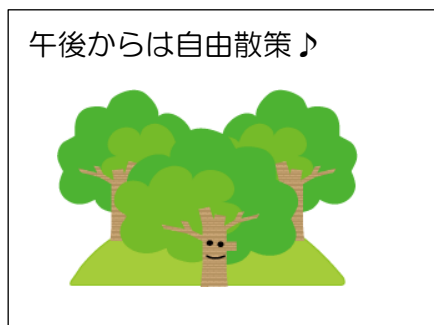
午後からは自由散策♪