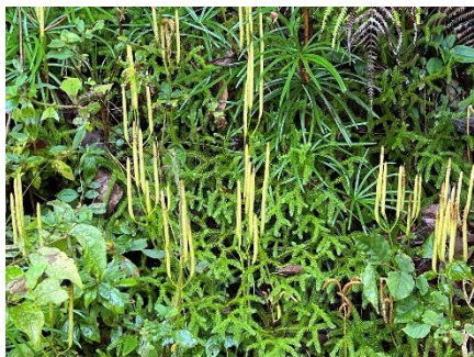
ヒカゲノカズラ 孢子囊穂