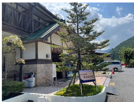
観察会を終え森の交流館を後に♪