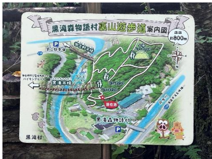
黒滝森物語村裏山遊歩道案内図