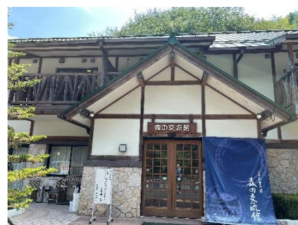
黒滝森物語村 森の交流館到着