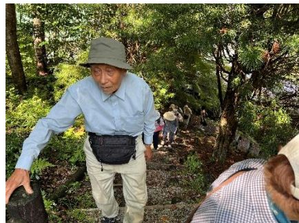
坂道なんて、へっちゃら♪