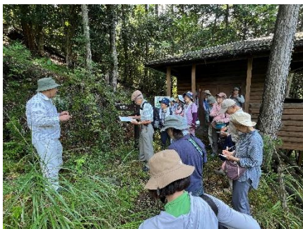
ヒカゲノカズラ インプリ川口