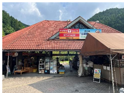
帰路、道の駅吉野路黒滝へ