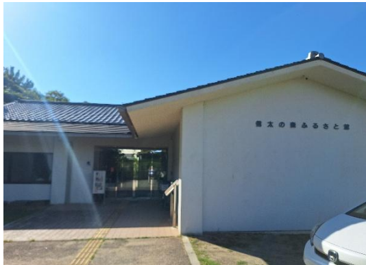
信太の森ふるさと館