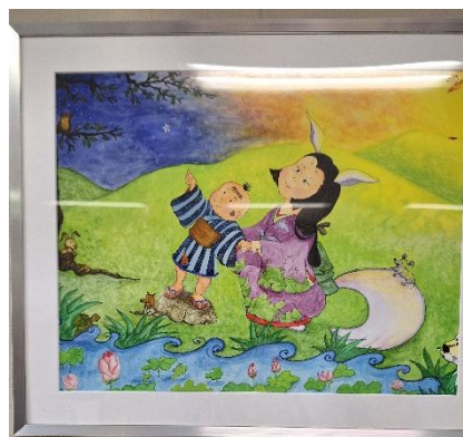
シンガーソングライターのイルカ氏の作品