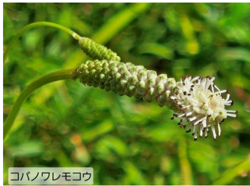
コバノワレモコウ