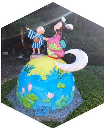
「信太の白きつね」モニュメント