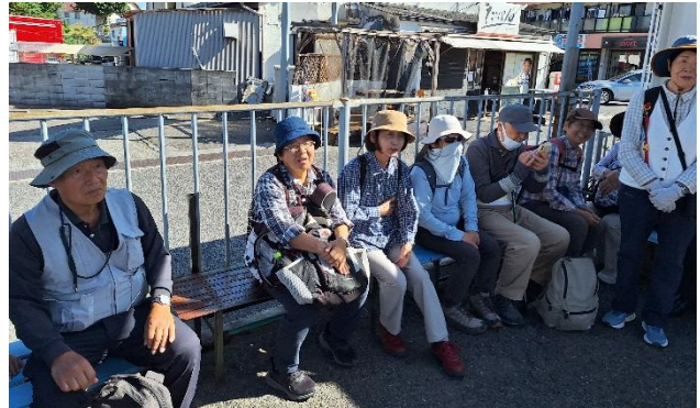
朝の挨拶 北信太駅筋バス停にて 信太山丘陵里山自然公園へバスで移動