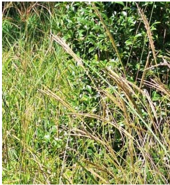
ウンヌケモドキ (絶滅危惧種)