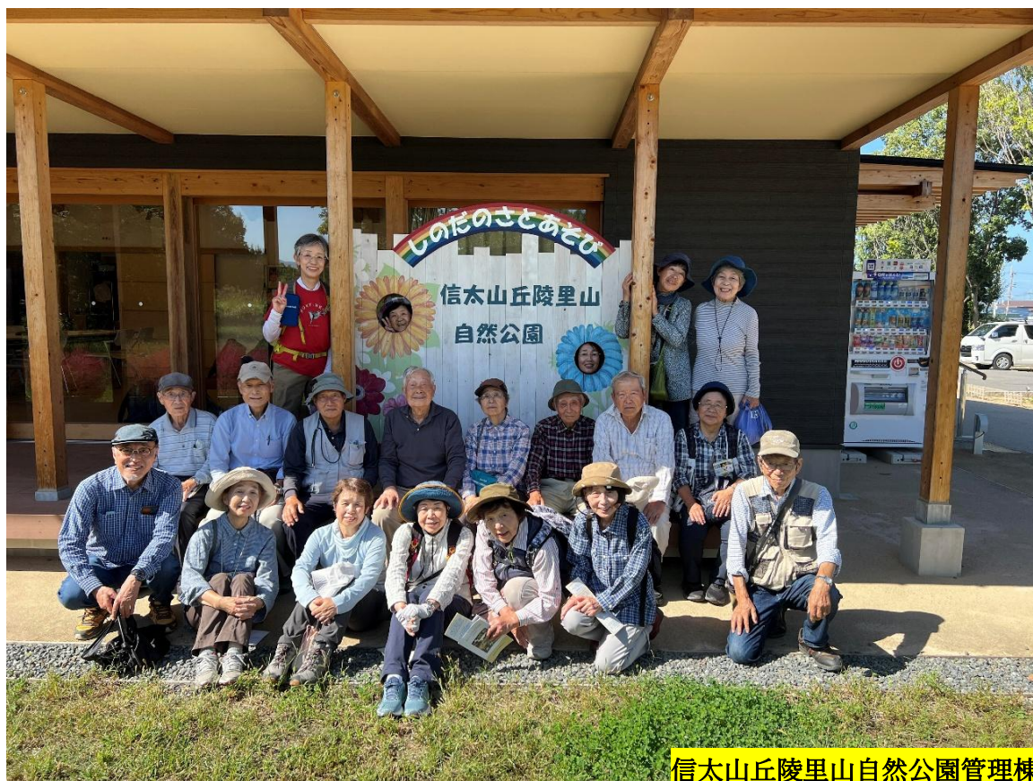
信太山丘陵里山自然公園管理棟