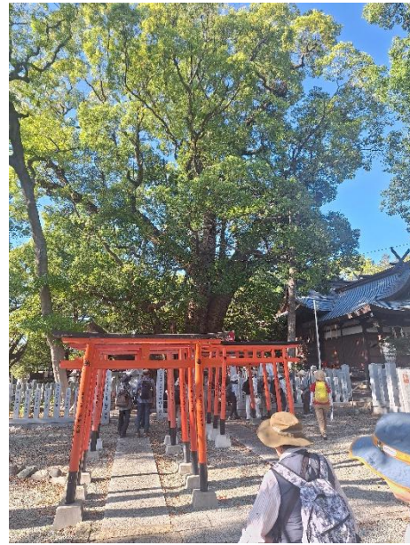
和泉市指定天然記念物 樹高 21m