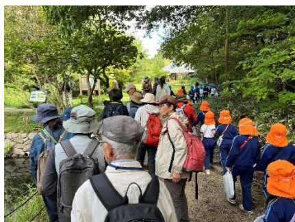
幼稚園児と遭遇、仲良く♪