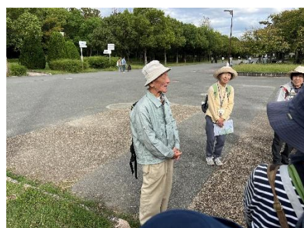
久方ぶりの観察会♪