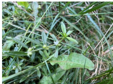
オオフトバムグラ