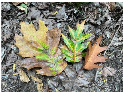
アカガシワ (レッドオーク)