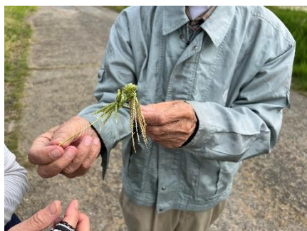
オヒシバ相撲 見合って