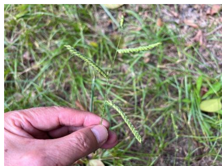
シマスズメノヒエ