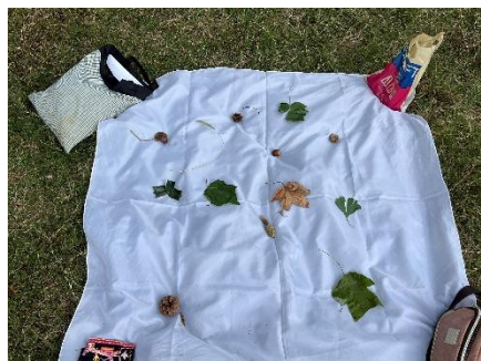
木の葉のカルタとり