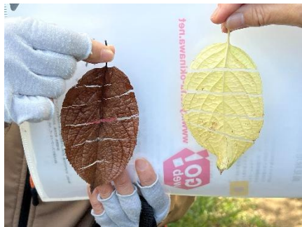
トチュウの葉 すだれ？