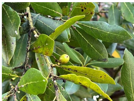
ゲッケイジュ果実