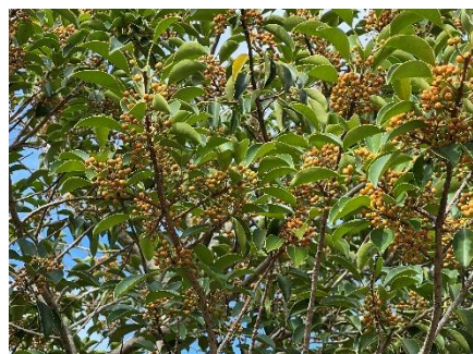
クロガネモチ（黄色実）