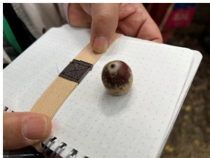
アカガシワの種子