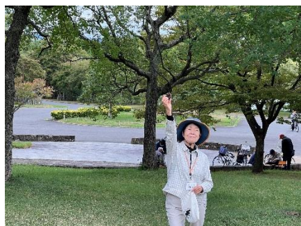
同じ葉や木の実を探して！