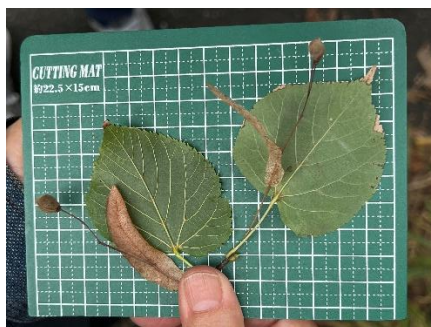
シナノキ (左) ボダイジュ (右)