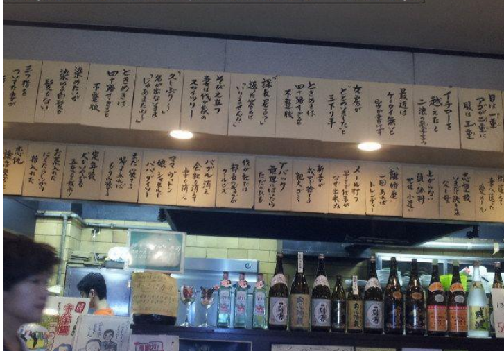
船場センタービル・食堂のサラリーマン川柳