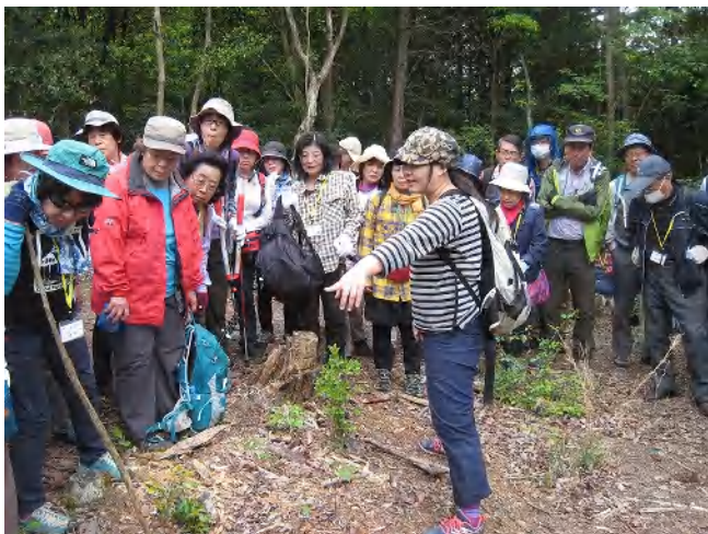
芽掻き作業：(コナラ、ミズナラの森を再生するため、伐採木の萌芽を取り除く)

「芽掻きは足を使うコツを覚えてから楽しくて、次から次へとやれました」(感想メモより)