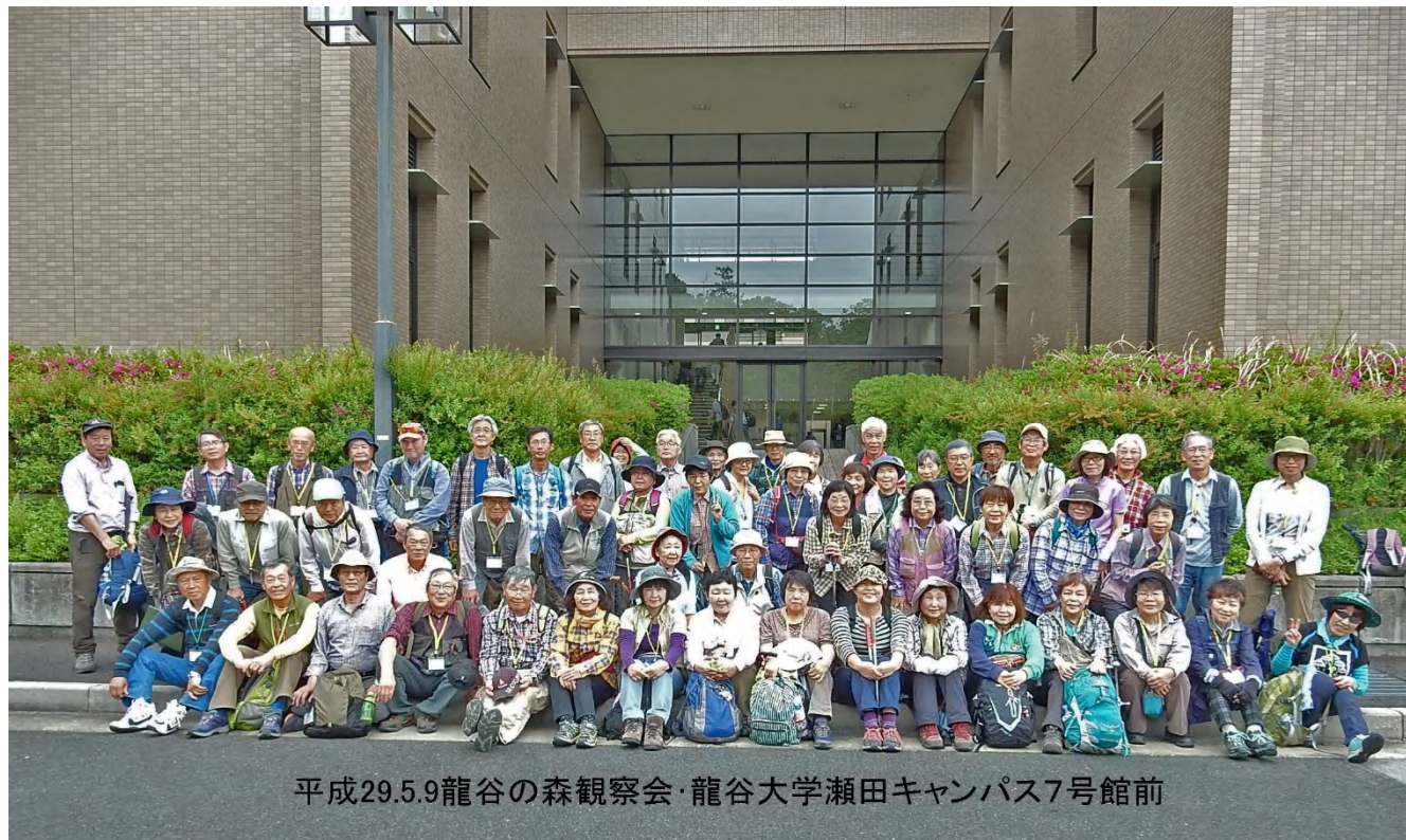
平成29.5.9龍谷の森観察会・龍谷大学瀬田キャンパス7号館前