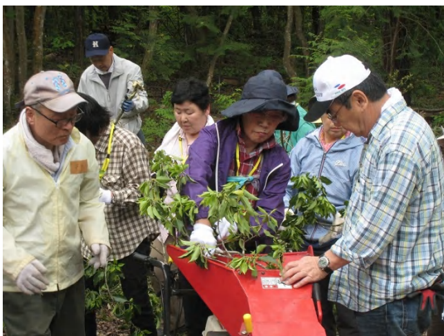
小枝を細かく砕くチップ作業

「チップターの経験は初めてです。日頃したことのない体験ができてよかった」（感想メモより）