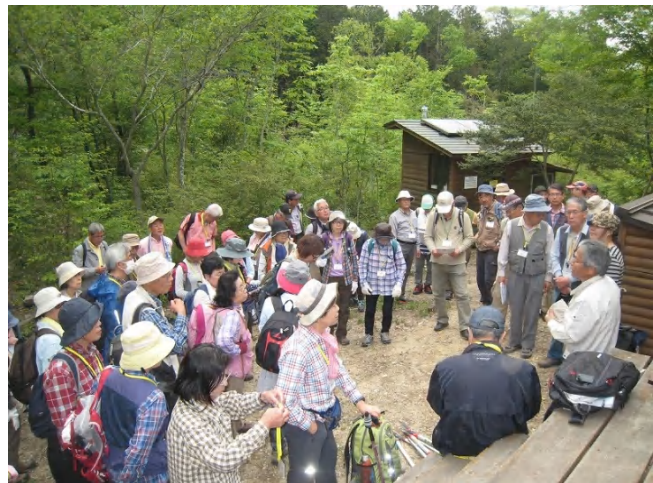
午後から龍谷の森で実習：作業説明

「午前中の瀬田、田上地区の景観と変遷の講義は今後の活動に大変参考になりました」（感想メモより）