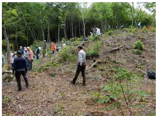
小面積皆伐エリア

「チップターの経験は初めてです。日頃したことのない体験ができてよかった」（感想メモより）