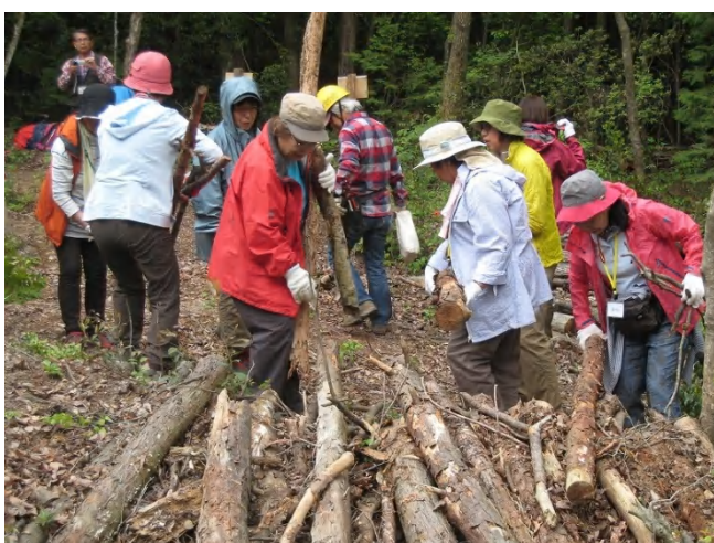
小枝伐りと運搬片づけ作業

「午後のマキ割りは初めて。いかにコツをつかむかが、大切だと感じました」(感想メモより)