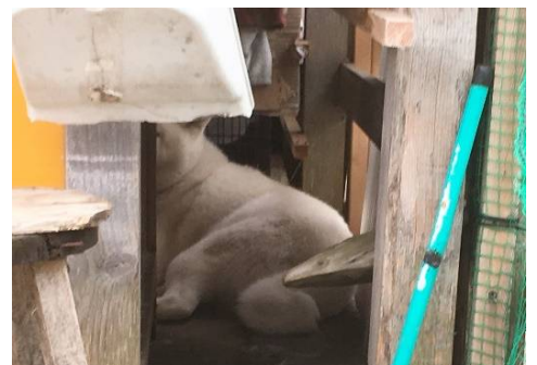
嫁のつばきは恥ずかしがり屋