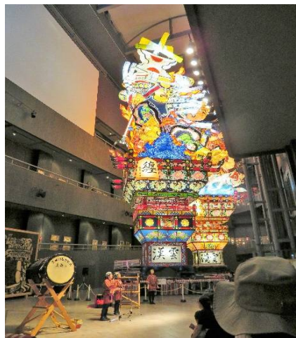
五所川原市 立佞武多の館