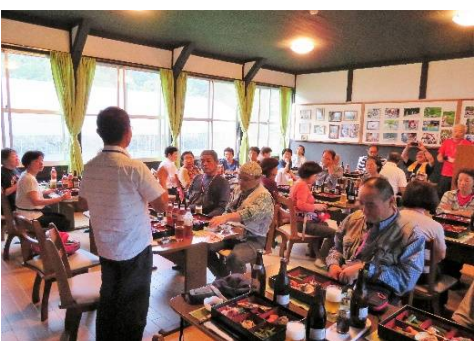
教室利用の農家レストランで夕食