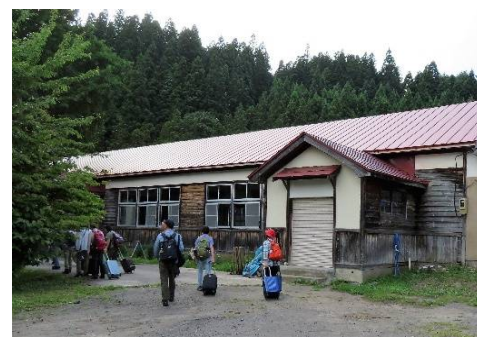
白神自然学校に到着