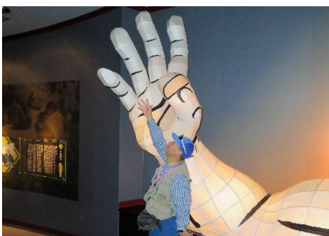
櫻井さんの手、小さい！！