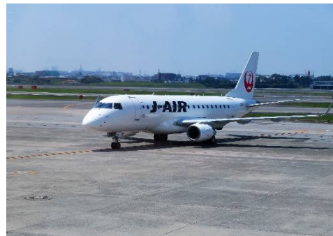
JL 2153 便