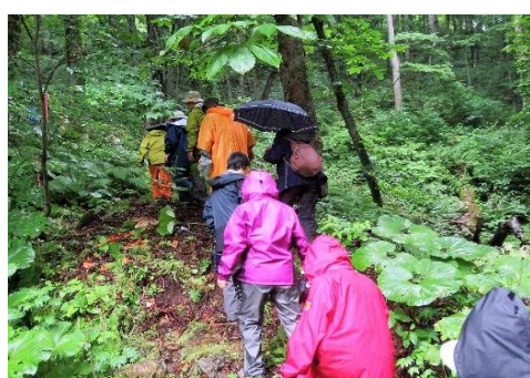
遺伝子保護林のトレッキング開始