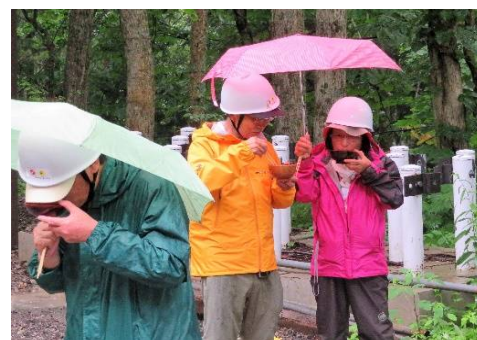
おにぎりと汁を立ち食い