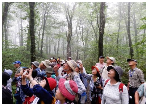
クマゲラの巣穴を見上げる