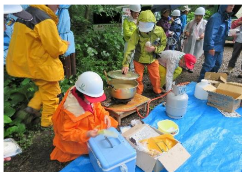
雨中での昼食準備