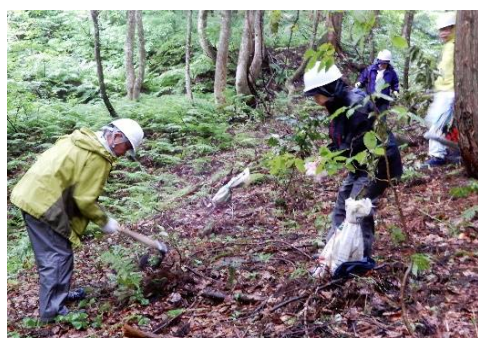
核心地域を守る緩衝帯を拡大する植樹