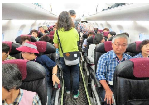
霧が晴れて無事搭乗