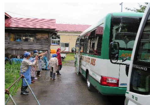
オバちゃんに見送られて