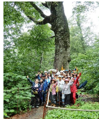
白神山地世界遺産センター西目屋自然保護管事務所にて マザーツリーの前で