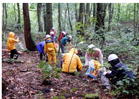
一人一本ブナの幼木を植樹