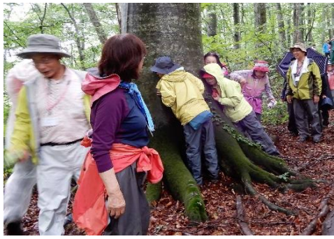
水を吸い上げる音が聞こえる？