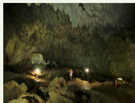
昇竜洞 （鹿児島県天然記念物）