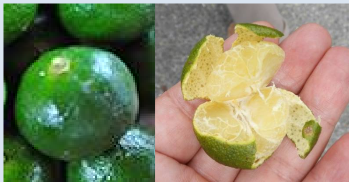
自生のシークワサー、少し酸っぱかった!!