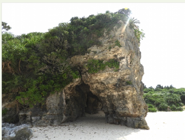
シビキニャ浜（正名海岸）西郷どんロケ地

・レンタカーでの自由観光、美ら玉づくり、観光協会キャラバンでの観光（田皆岬～シビキニャ浜）等各自で自由に楽しく時間を過ごしました。