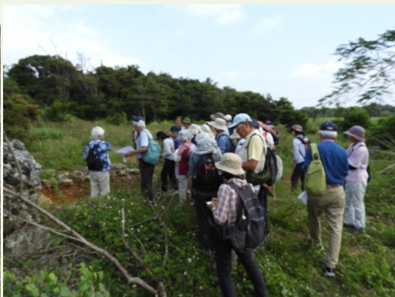
基盤岩(輝緑岩、輝緑凝灰岩)と石灰岩の境界を観察