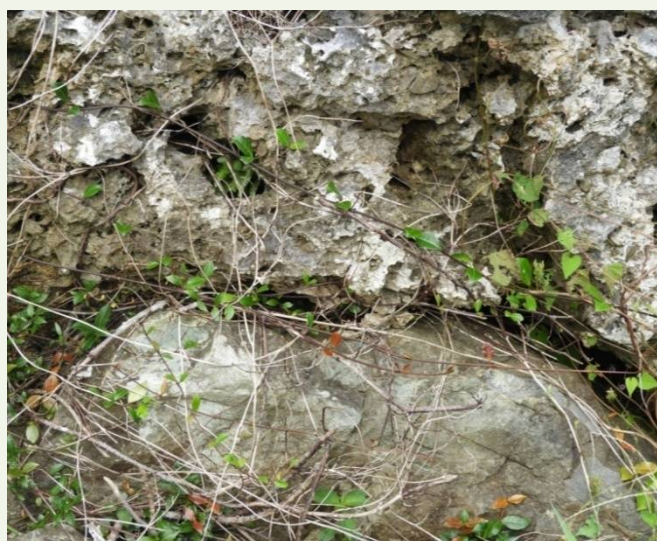
基盤岩(輝緑岩、輝緑凝灰岩)と石灰岩の境界