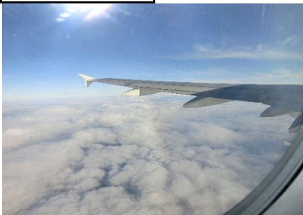
フィリピン航空 P R 407 便