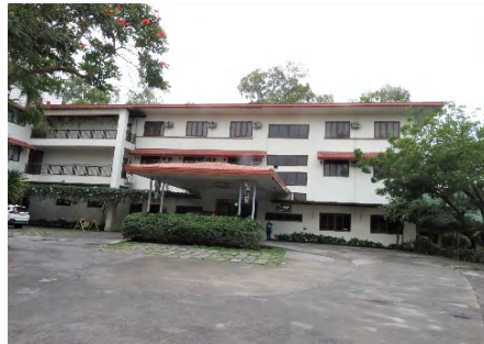
Nature's Village Resort