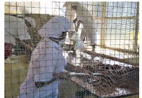
モルドバド糖の製造