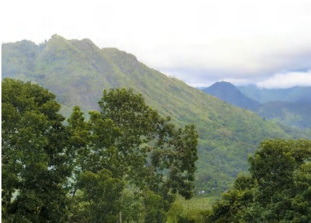
イフガオの山並み