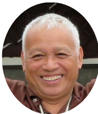
トトさん ゲストハウスオーナー