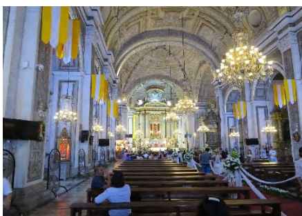
サンアングスチン教会